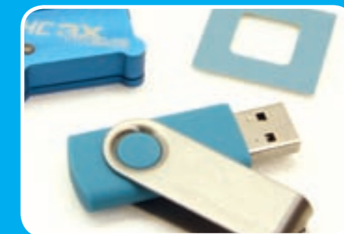
Auf dem USB-Stick sind alle erforderlichen Daten und Programme

Flugtechnisch kann der edle Zauberkasten voll überzeugen. Egal ob normale Rundflüge oder hartes 3D-Gebolze – das HC macht alles mit. Das Einrastverhalten ist sehr gut, ein Nachpendeln kann bei angepasster Kopfeempfindlichkeit nicht festgestellt werden. Speedflüge stellen ebenfalls keine große Herausforderung an das System, ein angepasstes Setup vorausgesetzt. Der Weg hierzu ist allerdings erst nach einer Hand voll Flüge gefunden und nur mit Zuhilfenahme der Anleitung gut zu bewältigen. Die Heckfunktion arbeitet ebenfalls gut, selbst in kleineren Helis wie dem T-Rex 450 sind gute Ergebnisse zu erzielen.