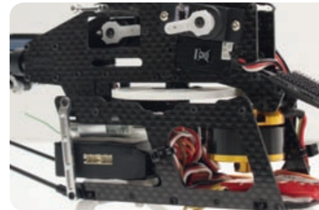
Das Mini V-Stabi findet auch im schmalen Rumpf des 250er-Rex Platz

Das Flugverhalten kann hier als absolute Referenz genommen werden.