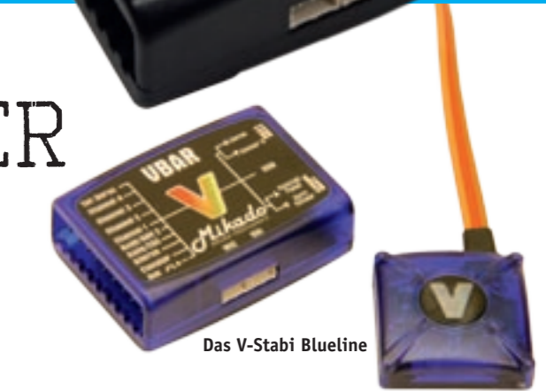
Das V-Stabi BlueLine

Das Flugverhalten kann hier als absolute Referenz genommen werden, alle Befehle werden sehr sauber und gut umgesetzt. Das Einrastverhalten bei 3D-Manövern ist extrem hart und zeigt keinerlei Tendenzen zum Nachwippen. Die Pirouettenoptimierung funktioniert beispielhaft und lässt keine Wünsche offen. Der Heckkreisel kann ebenfalls als Referenz genommen werden. Egal ob harte Stopps oder schnell geflogene Reversals – das V-Stabi macht alles mit. Hier setzt man nicht mehr darauf, einen Paddelkopf virtuell nachzubilden zu wollen, sondern vielmehr auf einen perfekt fliegenden Hubschrauber. Der direkte Umsteiger vom Paddelkopf wird hier zwar ein paar Gewöhnungsflüge brauchen, danach aber von Paddeln nichts mehr wissen wollen. Natürlich können auch Mehrblattrotorköpfe angesteuert werden, somit deckt das V-Stabi alle erdenklichen Anwendungen mit Bravour ab.